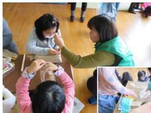
お母さん頑張ってる！

岐阜県園芸福祉協会 飛騨支部の皆さんに教わりながら、難しい部分もありましたが無事プランターが完成！